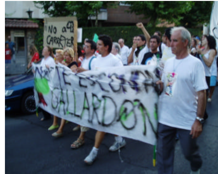
Manifestación vecinal en las calles de Carabanchel para reivindicar la supervivencia de un parque cuyo espacio iba a ser atravesado por una carretera, según los planes del Ayuntamiento de Madrid. La de estos manifestantes se corresponde con la estrategia de resignificación del propio espacio devaluado mediante la reivindicación del espacio público y el carácter obrero del barrio.

de los capitales de los que ahora se gozan (económico, cultural, social).